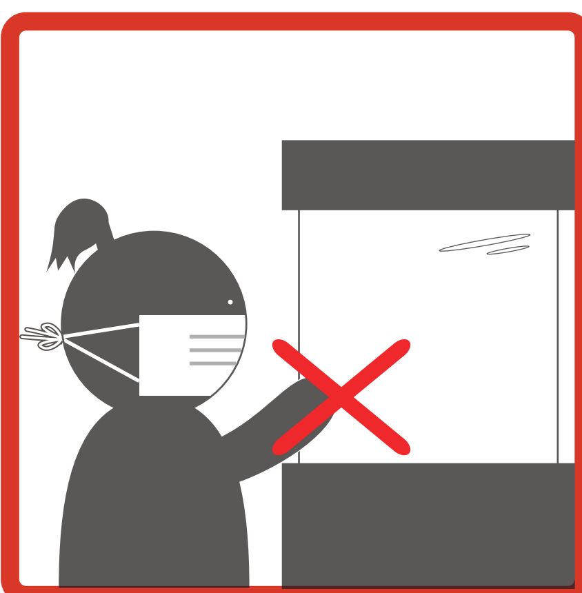
展示ケースや壁にさわらない