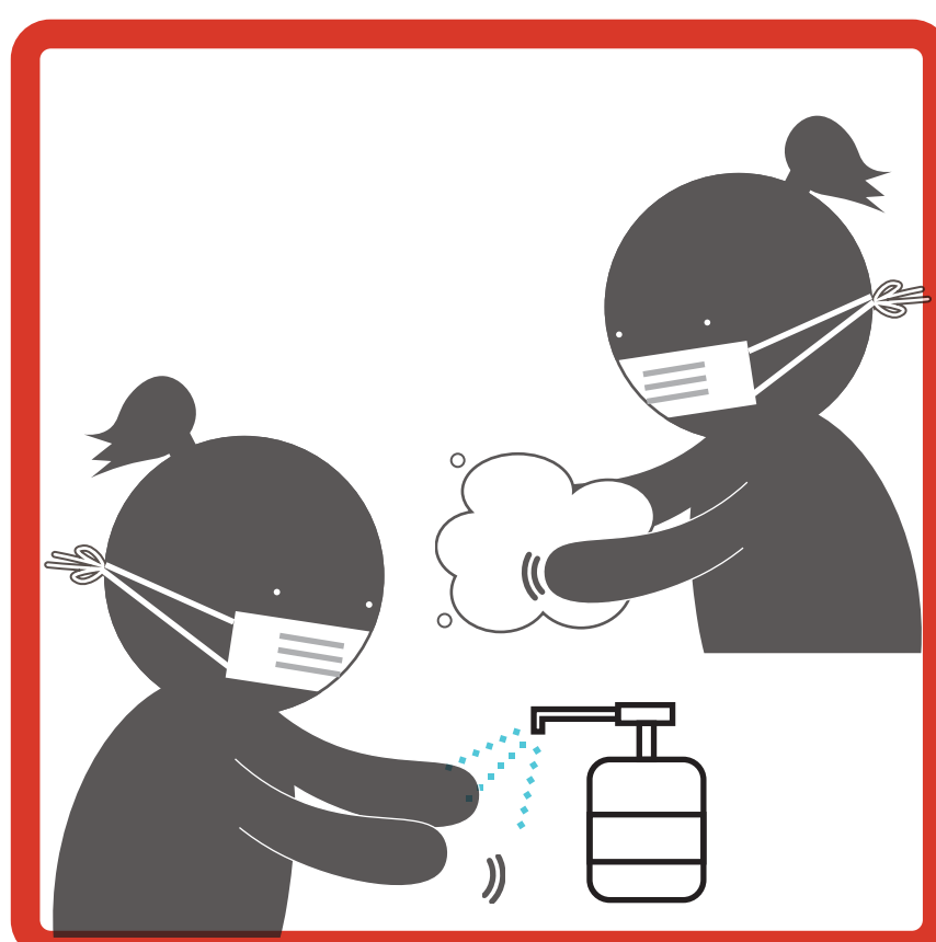
手を洗う・消毒する