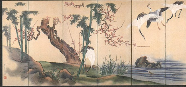
蓬萊図屏風(狩野林泉) 上/右隻 下/左隻