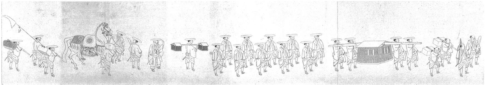
「南部利敬入部行列図」(部分)