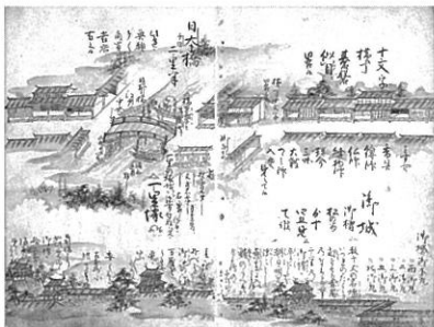
「増補行程記」のうち日本橋

もりおか歴史文化館 Morioka History and Culture Museum 活性化グループ