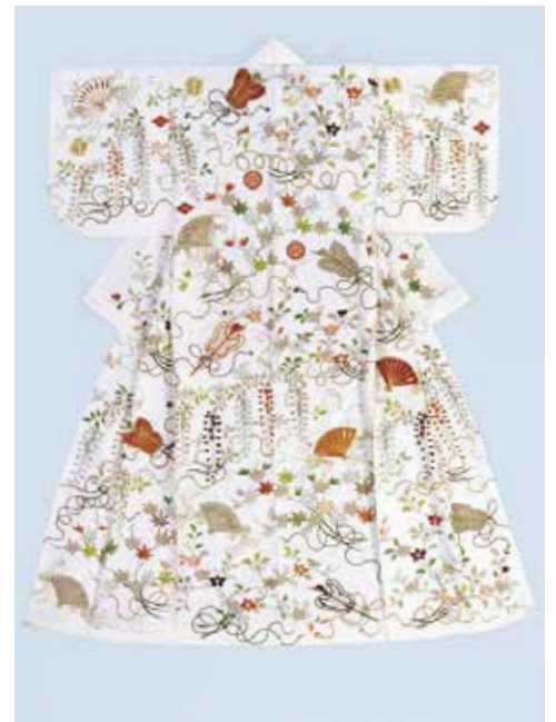
白縮子地定紋散花束松扇唐扇模様小袖