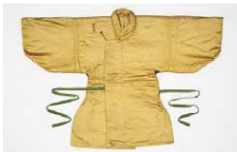
金茶縮子地亀甲草入具足下着

皆さんはどのような時に「和服」を着ますか。日本の民族衣装である和服ですが、現在、私たちは日常、洋服を着て生活しており、日常生活において和服に触れる機会は減りました。和服が身近に感じられなくなったのは、冠婚葬祭や年中行事など特別な日の衣装、僧侶や神職、伝統芸能の従事者、力士、旅館の女将や仲居といった特定の職業の仕事着、博物館や美術館でガラスケース越しに見る資料という印象が強くなってしまったことも一因かもしれません。 その一方で、2019年のラグビーワールドカップ、2020年の東京オリンピック・パラリンピックに向けて、訪日観光客への「おもてなし」として「日本・日本人らしさ」「日本の伝統文化」について考える機会、日本を表現する道具の一つとして和服に注目する機会、日本らしさを伝えたい・感じてもらいたいという気運は高まっているのではないのでしょうか。とはいっても「日本らしさ」を誰かに伝えるのは難しくありませんか。 華道・書道・茶道など日本の伝統文化として海外でも知られる習いごとを始めるのも一つの方法かもしれませんが、日本らしいものについての知識を得るというのはどうでしょう。本展では、当館で収蔵する盛岡南部家ゆかりの衣装を展示します。武家の衣装の形・素材・色・文様などを通して、日本らしさの一端に触れてみませんか。