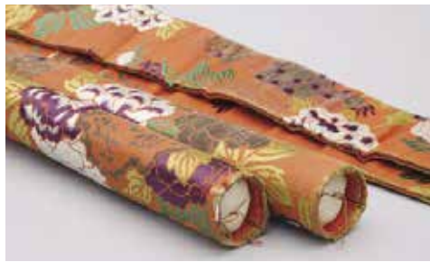
紅地唐獅子牡丹模様錦提帯(部分)

[日時] 8月19日(日)、9月23日(日)13:30~14:00 [会場] 2階 企画展示室(入場料が必要) [定員] なし(当日自由参加)