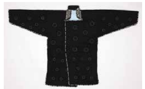
黒羅背板地亀甲散模様鎖入具足下着

主催 / もりおか歴史文化館 後援 / 盛岡商工会議所、中津川流域文化施設連盟「NACA」、岩手日報社、読売新聞盛岡支局、朝日新聞盛岡総局、毎日新聞盛岡支局、産経新聞盛岡支局、日本経済新聞社盛岡支局、河北新報社、盛岡タイムス社、岩手日日新聞社、デーリー東北新聞社、時事通信社盛岡支局、共同通信社盛岡支局、NHK盛岡放送局、IBC岩手放送、テレビ岩手、めんこいテレビ、岩手朝日テレビ、エフエム岩手、岩手ケーブルテレビジョン、ラヂオもりおか、マ・シェリ、情報紙ゆうゆう