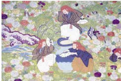
萌黄縮緬地狸々模様打掛(部分)

[日時] 9月2日(日)13:30~15:00 [会場] 1階 研修室 [内容] 江戸時代の切り紙遊びを体験。 [定員] なし(開始5分前までに受付が必要)