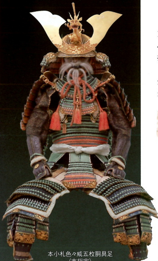
本小札色々威五枚胴具足 〈市指定〉

この企画展を通し、文化財は遠い存在ではなく、現代を生きる私たち一人ひとりにとってかけがえないものであり、次の世代へと大切に受け継いでいくべきものであると感じていただければ幸いです。