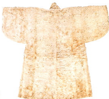
白地天鷲絨陣羽織 〈国指定〉