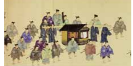
「祭礼行列図巻」より