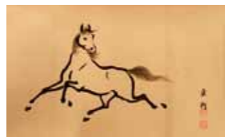
「貞行真蹟画馬巻」より

労働力として、生活を共にする仲間として、食料として…。動物たちは古来より、人々の生活に深い関わりを持ってきました。本展では、盛岡藩の歴史に、ときに人々の助けとして、ときに脅威として現れる動物たちを、彼らが登場する資料と共に紹介します。えがかれた動物たちの姿を通じ、盛岡に暮らした人々と彼らとの関わり方を探ってみましょう。