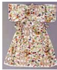
「白麻地南天掛花入藤立涌模様帷子」