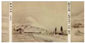
「岩手県鉄道沿線名勝図巻」より