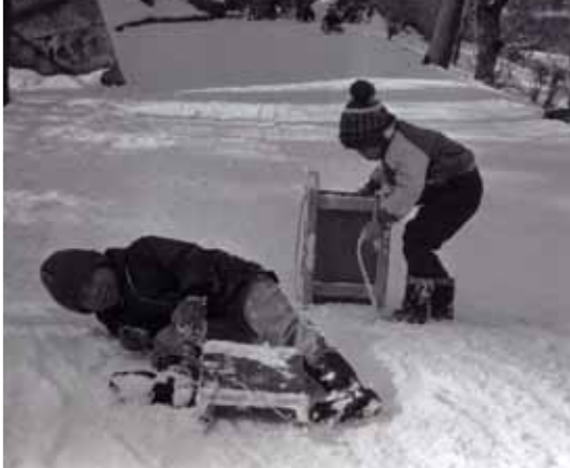
「ソリ遊び(昭和40年代)」