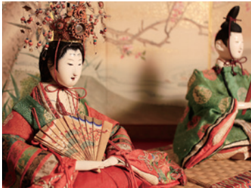
旧中村家所蔵「内裏雛」

「ひな祭り」は、古来中国の「上巳 の節句」と平安中期の宮中の子ど も達の「ひいなあそび」と呼ばれ る人形遊びが結びついた行事で す。江戸中期ごろには、雛人形 を飾り、女兒の健やかな成長を 祈る行事として庶民に広く親しま れるようになりました。雛人形、 雛道具を愛で、ひと足早く春をお 楽しみください。