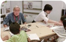
夏休み自由研究相談室

8/7(日) ～8/13(土) 10:00～12:00/13:00～15:00 夏休み自由研究相談室