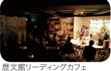
歴史館リーディングカフェ

12/25(日) 14:00～15:00 歴史館リーディングカフェ ※予約制(11/18、10:30から電話受付開始) で、定員15人