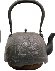
「節分図南部形鉄瓶」