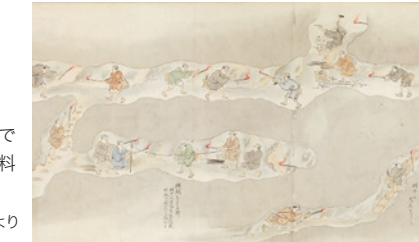
「奥州盛岡金山稼方之図」より