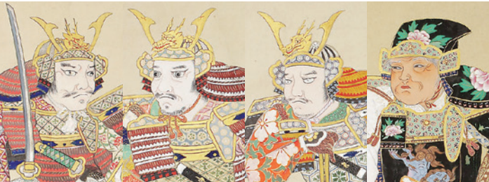
「南部家歴代当主画像」より