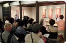
盛岡弁で語る昔話