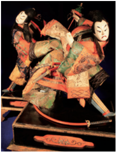
旧中村家所蔵「竹田人形」

盛岡南部家の歴代当主の実態を掘り下げることで、盛岡の「殿様」の実像に迫るとともに、改めて盛岡の歴史を辿ります。今回は南部信直・利直・重直・重信4代の、戦国時代から江戸時代に向かう転換期に焦点をあて、「盛岡」のルーツを探ります。なお平成29年度に第2部を、平成30年度に第3部を開催予定です。