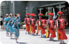
盛岡さんさ踊り公演

5/4(水・祝) ①11:30～、②13:00～ GW特別イベント 盛岡さんさ踊り公演