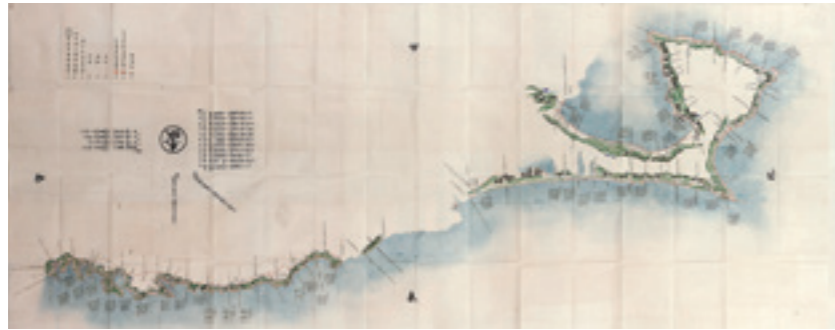
陸奥国盛岡領海岸絵図面

盛岡藩には、藩政のため領内各地を奔走した名もなき実務官吏が多くいました。本展は、そのなかの一人、盛岡藩士・漆戸茂樹(1790～1870)の生涯を通じて、「盛岡」の歴史の新たな一面を発見しようとする試みです。漆戸茂樹が制作した絵図や関係資料などから、盛岡藩士の生き方や江戸時代末期の盛岡藩の様子をご紹介します。