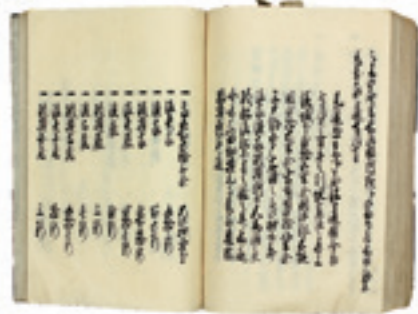
利剛公御在府・御留守留(安政3年)

企画展 災害の記憶 — 盛岡藩の災・救済・復興 — 1月20日(水)～3月15日(月) あの東日本大震災から10年が経とうとしていますが、この間にも日本全国で大災害が頻発しました。大きな悲しみと多くの教訓を残した災害の記憶は風化させない努力が必要です。本展では、江戸時代を通じて多くの災害に見舞われた盛岡藩に関する資料を手掛かりに、過去の災害の実態や、災害への対応についてをご紹介します。